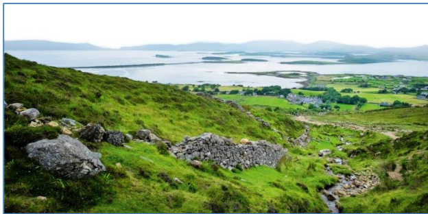
Вид с горы Крох

Незадолго до своей кончины Патрик на 40 дней удалился на гору Крох, проводя дни и ночи в молитве. Гора Крох стала местом, откуда святой простёр руки и благословил весь ирландский народ.