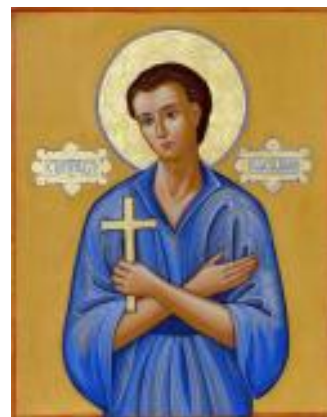
св. Иоанн Русский

Ещё больше интересных статей см. на сайте: https://небесный-дом.рф