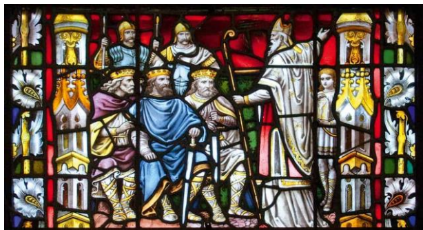
Святой Патрик обращается к королям Ирландии; витраж в Успенском Соборе в Карлоу

Удивительно, но будучи уже вне уз рабства, и даже встретившись с родителями, Патрик не меняет свое рабское прозвище. Он никогда более не будет носить имя, полученное им на свободе. До конца дней своих