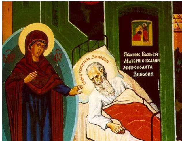
Рис.: Явление Богородицы в келье митрополита Зиновия.

Во время блокады Ленинграда отец Зиновий, как и многие другие, горячо молился о спасении осаждённого города. Тогда старец удостоился видения, о котором вспоминал так: «В это же время и мне под утро в тонком сне привиделось, как святая Нина предстоит пред Престолом Божиим на коленях и молит Господа помочь страждущим людям осаждённого города одолеть супостата. При этом из её глаз катились крупные, величиной с виноградину, слезы. Я это растолковал так, что Божия Матерь дала послушание святой Нине быть споручницей этому осаждённому городу».