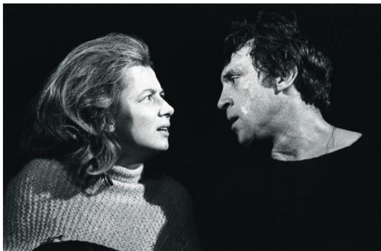
Алла Демидова (королева Гертоуда) и Владимир Высоцкий (принц Датский) в спектакле «Гамлет», 1971 г.

— А мне в 1997 году выпала честь привести Святой Огонь в Новосибирск! Мы пришли в Храм Гроба Господня задолго до схождения Благодатного Огня, устроились на балкончике прямо напротив кувуклии. Невозможно описать увиденное. Море огня! Я видел, как