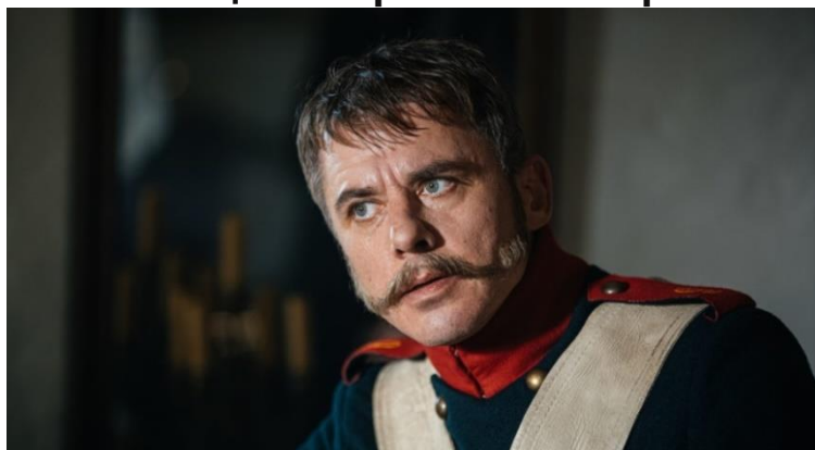
Игорь Петренко в фильме "Союз спасения. Время гнева" (2022).

пропали бы вообще все люди. Наверное, миссия россиян — быть сдерживающим фактором, где-то даже влияющим на развитие мировой культуры. Сейчас у нас есть возможность, о которой мечтали наши деды: без чьих-либо наставлений построить собственный мир. Хочу верить, что у нас всё получится, каждый из нас сумеет изменить что-то в себе, сделает лучше свой «квадратный метр». Если каждый из нас сможет измениться, то изменится и весь мир.