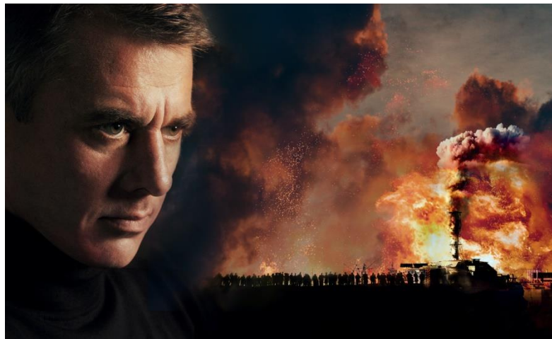
Игорь Петренко в сериале «Чернобыль»