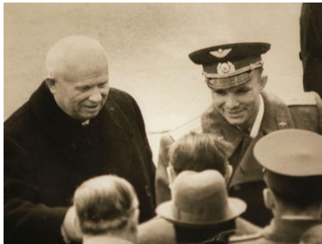
Россия. Москва. 16 апреля. Никита Сергеевич Хрущев и Юрий Гагарин - на снимке 1961 года.

В Индии дорогу кортежу с первым космонавтом преградила священная корова. Машины простояли около часа. Гагарин отнесся к этому с юмором, заметив, что как раз за это время он облетел бы «вокруг шарика». А в Африке в одном из наиболее глухих мест пришлось ехать в броневиках — боялись воинственных пигмеев с копьями и луками. «Не знаю уж, каким образом, но уговорил Юра сопровождающих — опустили пуленепробиваемые стекла», — вспоминал Валентин Гагарин. Лучезарная гагаринская улыбка утихомирила пигмеев, и они тоже заулыбались.