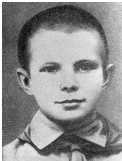
Летчик-космонавт СССР, Герой Советского Союза Юрий Гагарин в школьные годы. После принятия в пионеры. 1940-е годы.