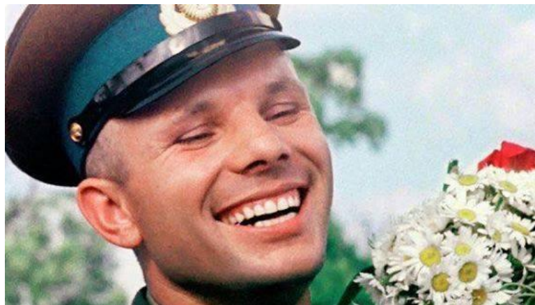
Знаменитая улыбка Гагарина