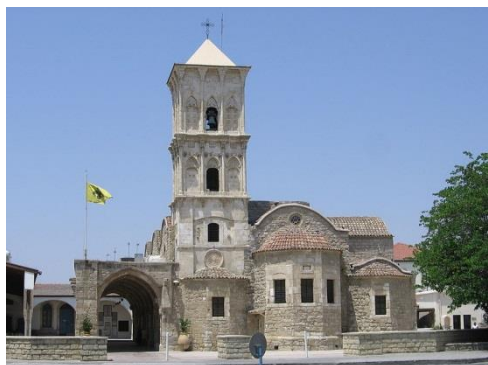
Церковь святого Лазаря в Ларнаке, построенная на его могиле. Кипр

Во время Своей земной жизни Христос сотворил чудо воскрешения из мертвых трижды. Сначала Он воскресил сына наинской вдовицы, которого уже несли хоронить. Второе чудо воскрешения было совершено Господом над двенадцатилетней дочерью Иаира. И наконец, третье – чудо воскрешения из мертвых Лазаря четверодневною.