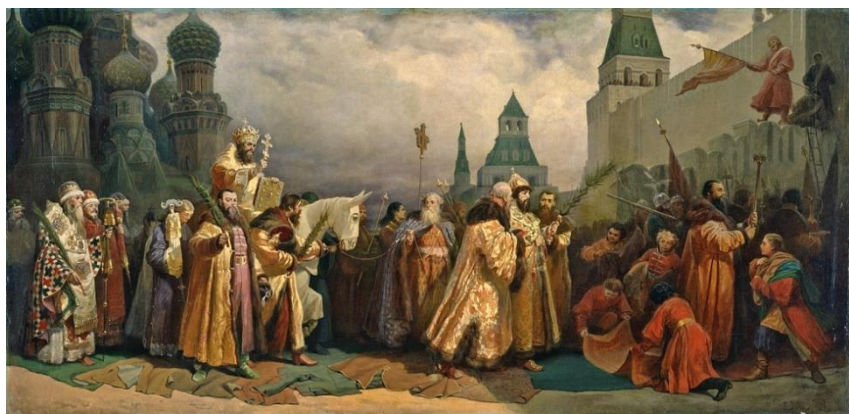
В. Г. Шварц. «Вербное Воскресение в Москве при царе Алексее Михайловиче. Шествие патриарха на осляти», 1865 г.

В России XVII в. в этот день совершался красочный обряд «Шествия на осляти». Особенным великолепием он отличался во времена патриарха Никона (1652–1658) и царя Алексея Михайловича. Шествие начиналось от Царской площади у Покровского (Василия Блаженного) собора, в котором патриарх и царь облачались в шитые золотом и жемчугами ризы. На Лобном месте происходила раздача ветвей вербы и даже настоящих пальмовых ветвей, привозившихся из Персии. Затем царь, пешком, вёл лошадь (вместо осла), на которой сидел патриарх, за красный повод,