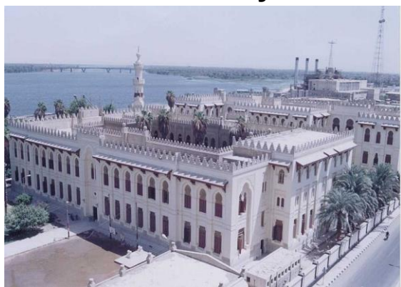
Город Асьют (Египет),

Пришедшим к нему монахам преподобный Иоанн говорил быть всегда смиренными. «Если кто-либо будет хвалить вас, демон или человек, не слушайте того и не превозносите умом своим, потому что и меня часто ночью искушали бесы, не давая мне ни молиться спокойно, ни уснуть, представляя глазам моим разного рода привидения в течение всей ночи; с наступлением же утра бесы кланялись с бранью пред мною до земли,