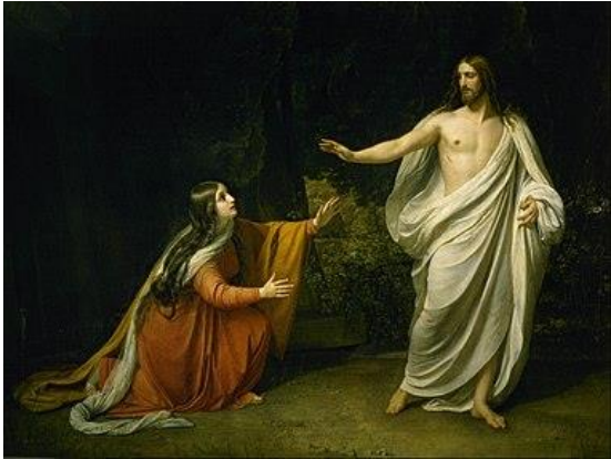
Явление Христа Марии Магдалине после воскресения. Худ.: А. Иванов

Сказав это, она оглянулась назад и увидела стоящего Иисуса Христа, но от великой печали, от слёз и от уверенности своей, что мертвые не воскресают, она не узнала Господа.