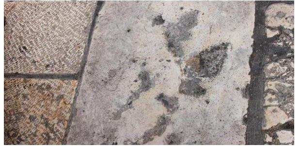
Место возле Храма Гроба Господня, о котором говорят, что это следы Анвара.

Слава Господу, не оставляющему нас грешных, но постоянно укрепляющему нас маловерных чудесами Своими в истинности православной веры.