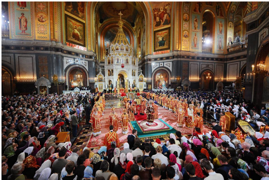
Пасхальное Богослужение в Храме Христа Спасителя (г. Москва)

Справка: Это «Слово на Пасху» святителя Иоанна Златоуста читается в храме во время ночной праздничной службы перед началом литургии после пасхального канона. Таким образом Церковь признает это слово единственным полностью выражающим смысл Праздника, настолько полно, что без него немислима