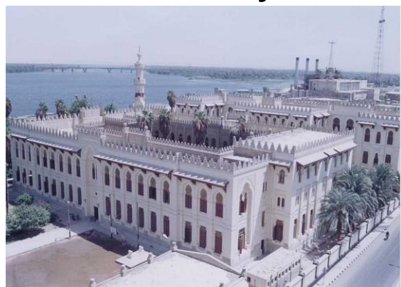
Город Асьют (Египет), в древности – Ликополь.

Преподобный предсказывал многое, имеющее совершиться в будущем, и своим согражданам, жителям города Ликополя, постоянно приходившим к нему ради душевной пользы своей. Он открывал им как то, что должно было совершиться в будущем, так и то, что было кем-либо сделано тайно от других. Преподобный Иоанн предсказывал, например, о разливе