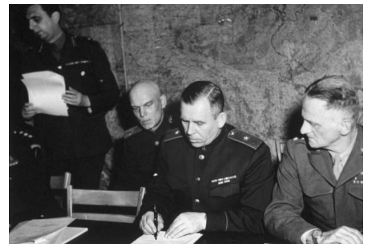
Генерал-майор И.А. Суслопаров подписывает акт о капитуляции Германии в Реймсе 7 мая 1945 года

Первая капитуляция была подписана 7 мая в заштатном французском городе Реймсе. От лица Третьего рейха свою подпись под документом поставил начальник оперативного штаба Верховного командования вермахта генерал-полковник Альфред Йодль. От англо-американской стороны подписывал акт о капитуляции генерал-лейтенант армии США, начальник Главного штаба Союзных экспедиционных сил Уолтер Беделл Смит. А с нашей привлекли для этого малоизвестного второстепенного генерала Ивана Суслопарова* (* - советского военного атташе во Франции). Представитель французского военного руководства подписал акт в качестве свидетеля. Документ был составлен на английском языке, и только английский текст признан официальным.