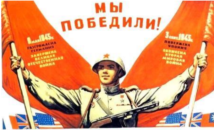
СЛАВА ВЕЛИКОМУ НАРОДУ, НАРОДУ-ПОБЕДИТЕЛЮ!

Удивительные совпадения и знамения, которые сопутствовали нашей победе в 1945-м и о которых писать тогда не было разрешено. Наверное, не найдется у нас в стране