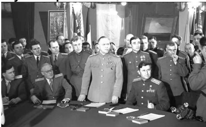
Маршал Советского Союза Г.К. Жуков - во главе советской делегации на церемонии подписания безоговорочной капитуляции Германии.