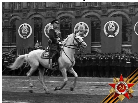
Фото: Парад Победы на Красной площади 24 июня 1945 года принимает маршал Георгий Жуков.

Третье: Пасха в том победном сорок пятом совпала с днём нашего небесного покровителя. А Пасха редко когда бывает в мае, обычно она бывает в апреле, но чтобы она совпала еще с днём св. Георгия Победоносца, такое бывает только раз в десятки лет.