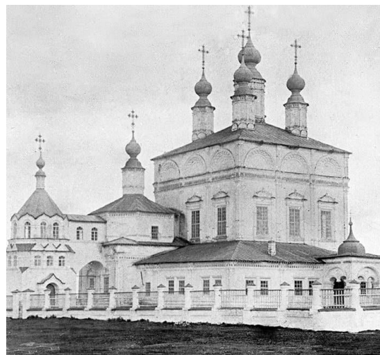
Воскресенский собор, Лальск