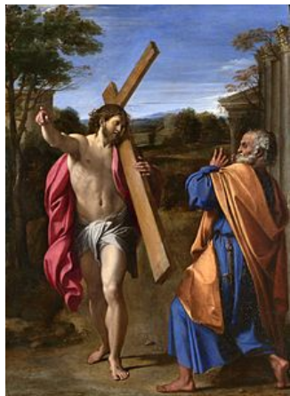
Domine, quo vadis?* , Аннибале Карраччи, XVII в. *старо-слав.: Камо грядеши, рус.: Куда идёшь, Господи?

Возблагодарив Бога, святой Петр остался на несколько дней в Британии, и на двенадцатый год правления Нерона прибыл в Рим. Многие в Риме благородные и знатные мужи и жены просвещались верою и святым крещением. Были же у царя Нерона две жены, замечательной красоты, которых он любил более всех прочих своих наложниц. Приняв святую веру, они решили вести целомудренную жизнь. Он же разгневался за это на всю церковь верных, а особенно на апостола Петра. Когда святого Петра искали для убиения, верные просили его, ради пользы многих, скрыться, – удалиться из Рима. Апостол никак не соглашался на это, желая лучше за Христа страдать и умереть; верующие же с плачем умоляли апостола сохранить жизнь свою, столь нужную святой Церкви. Склонившись на слезные мольбы, святой Петр дал обещание скрыться из города, и в следующую ночь, простившись со всеми после соборного моления, удалился один.