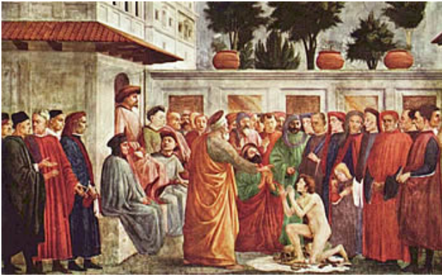
«Воскрешение усопшего апостолом Петром», Филиппо Липпи, XV в.