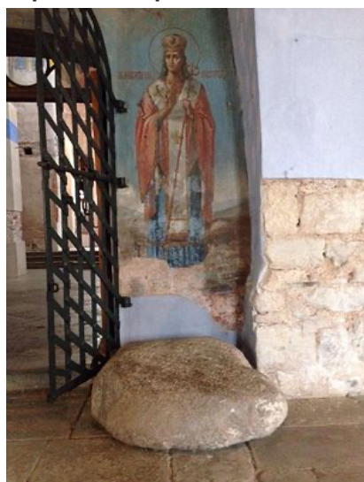
Кусок камня, на котором приплыл преподобный Антоний

Необыкновенную судьбу преподобного показал в стихотворении «Антоний Римлянин, новгородский чудотворец» протоиерей Александр Братолюбов - известный в дореволюционной