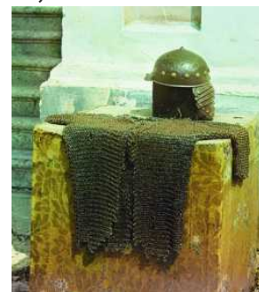
Доспехи прп. Далмата

Преподобного считают покровителем Сибири, а еще у могилы Далмата с давних пор молились перед отправкой в армию новобранцы. Ведь у гробницы преподобного вплоть до революции лежали шлем и кольчуга, которые Илигей подарил монаху в знак примирения. Некоторые паломники сообщали об исцелении от болезней после соприкосновения с доспехами преподобного.