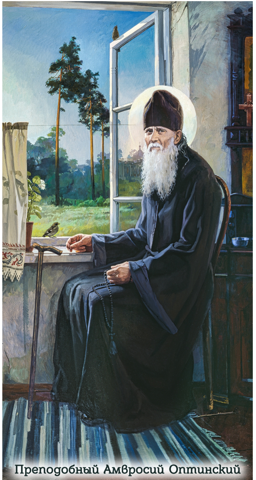
Преподобный Амвросий Оптинский

Александр окончил Духовное Училище, затем прошел успешно курс в Духовной Семинарии. Однако не пошел в священники. Некоторое время был домашним учителем в одной помещичьей семье, а затем преподавателем Липецкого Духовного Училища. Обладая живым и веселым характером, добротой и остроумием, Александр был очень любим своими товарищами и сослуживцами. В последнем классе семинарии ему пришлось перенести опасную болезнь, и он дал обет постричься в монахи, если выздоровеет. По