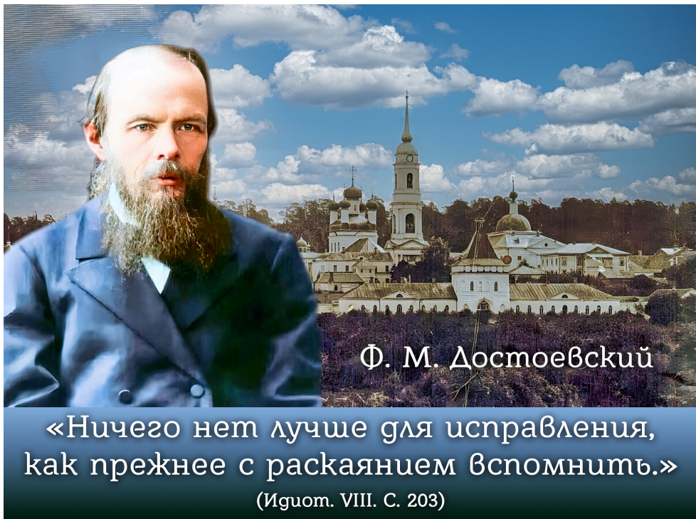
Ф. М. Достоевский