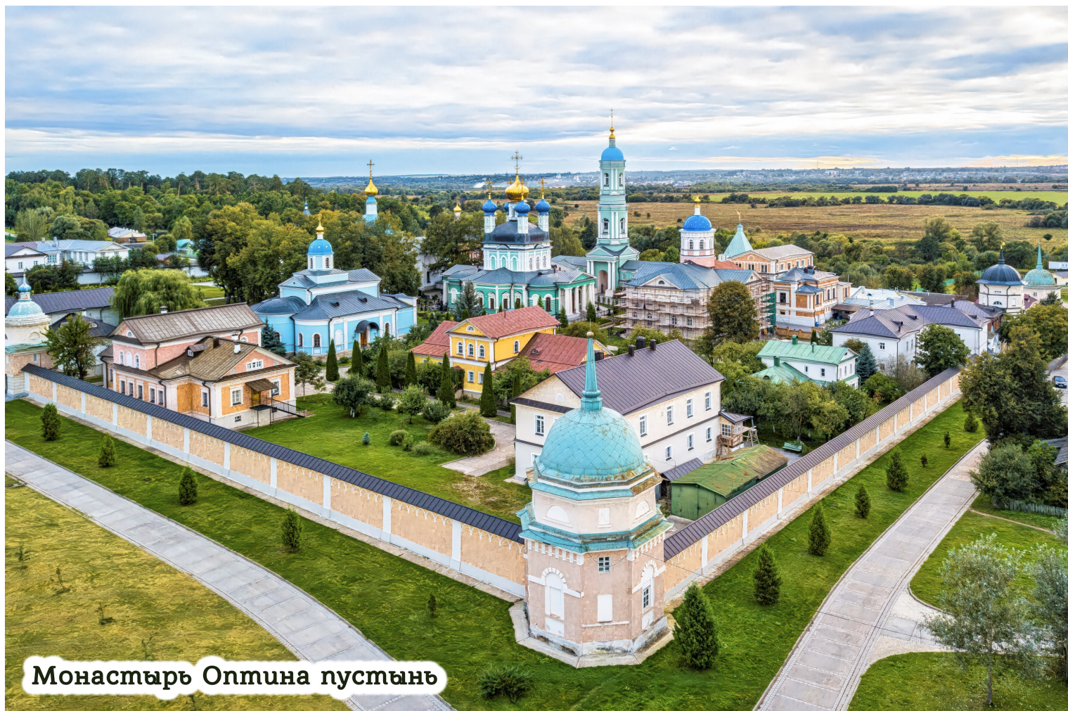
Монастырь Оптина пустынь

Мы должны жить на земле так, как колесо вертится, только чуть одной точкой касается земли, а остальными непрерывно вверх стремится; а мы, как заляжем на землю, и встать не можем.