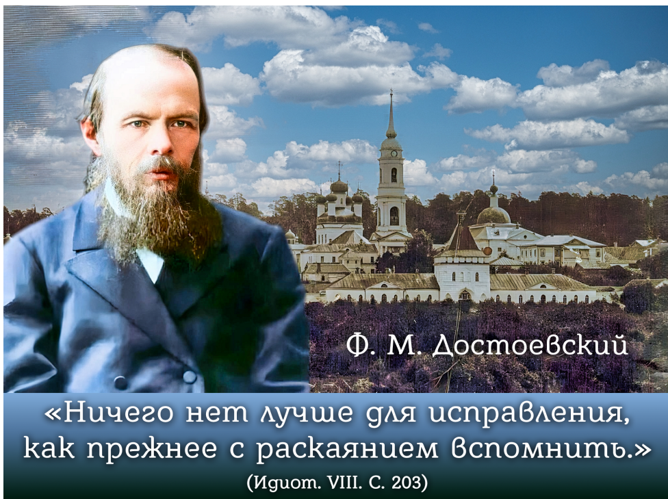
Ф. М. Достоевский